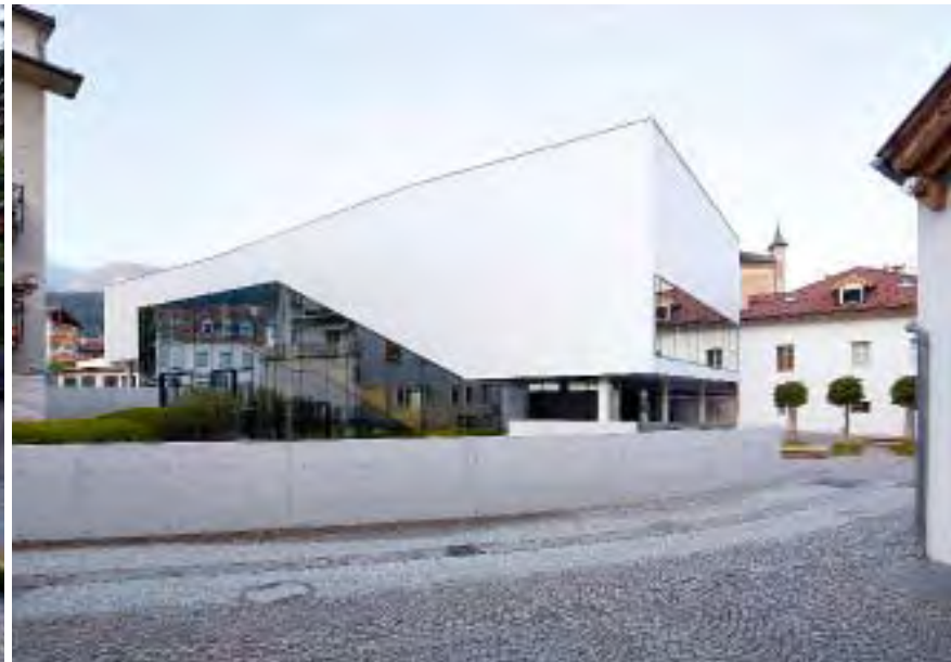
Das leicht abfallende Grundstück hat Einfluss auf die Fassadengestaltung: Der Höhenversatz wird in der Abschrägung der Pfosten-Riegel-Konstruktion deutlich.