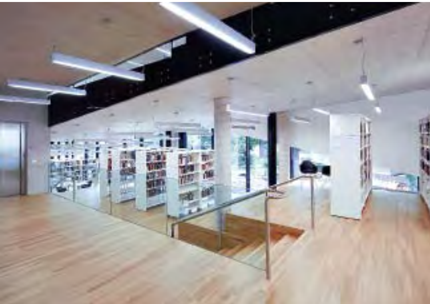
Durch die verschiedenen Ebenen entstehen Teilbereiche, die – von Tageslicht durchflutet – individuelle Lese- und Arbeitsmöglichkeiten bieten.