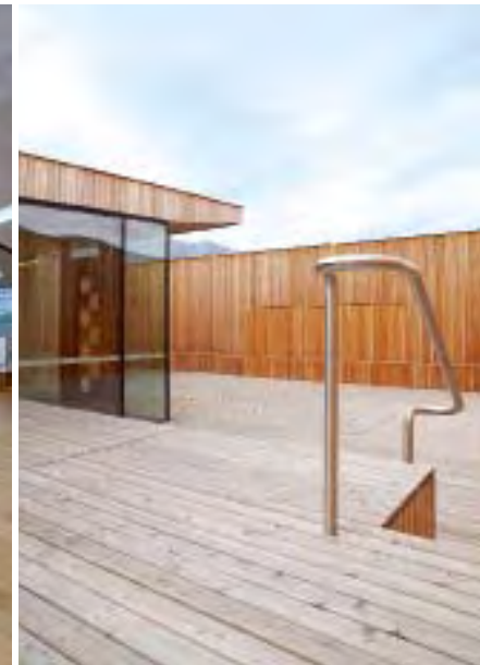
Teilweise geschützt, teilweise mit Aussicht: die Dachterrasse.