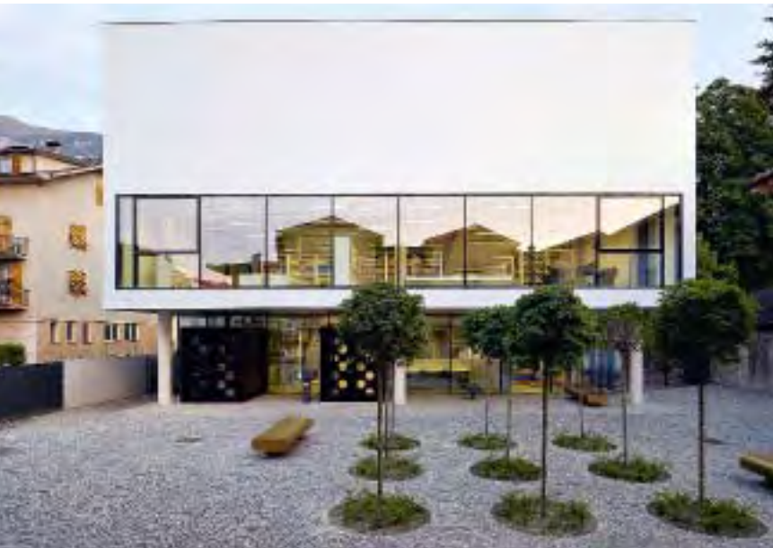
Vor einem der Zugänge wurde ein neuer Platz gestaltet, der dem Bereich mit einem Schattengarten und Sitzbänken mehr Aufenthaltsqualität verleiht.