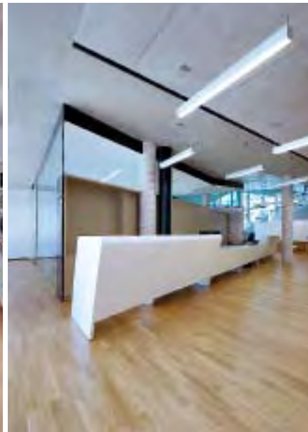
Der frei geformte Tresen ist das auffälligste Möbelstück und zentrale Anlaufstelle der Bibliothek.